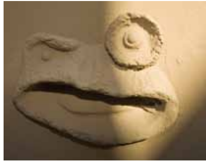
2 Het Thomasmahuis met 'kikkerbrievbus'