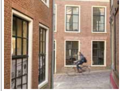
3 De Muggesteeg