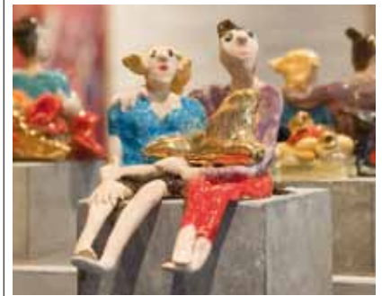
6 Galerie De Kleine Hoogstraat