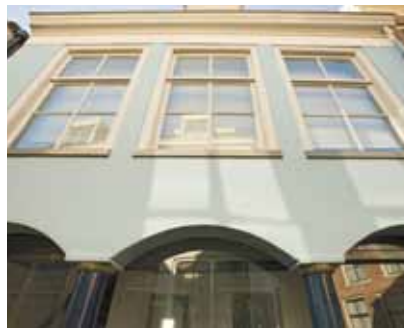
5 Stoeptegels en braadpannen